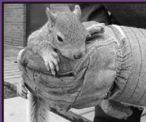
Petit âgé de 4 semaines.