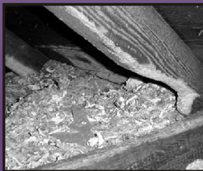
Nid d'écureuils et éclats de fermes de toit rongées.