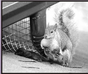
Mère relocalisant ses petits.

Nos techniciens spécialisés en faune sauvage sont spécifiquement formés pour faire l'exclusion des écureuils sans les blesser ni leur imposer un stress inutile. Cette approche est également économique et pratique. La destruction, la capture et la relocalisation inhumaines des écureuils sont illégales. Le retrait des mères écureuils provoque la mort des petits qui sont abandonnés à la famine dans le bâtiment. Le retrait des carcasses est un processus qui est long, coûteux et occasionne un risque à la santé. Nous sommes chef de file dans l'industrie du contrôle de la faune sauvage car nous mettons l'emphase sur l'éducation et la prévention.