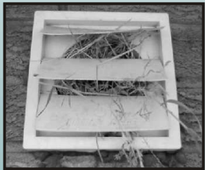
Matériaux divers servant à faire le nid dans l'orifice d'aération.

Nos techniciens spécialisés en faune sauvage sont spécifiquement formés pour faire l'exclusion des oiseaux et de leurs nids sans les blesser ni leur imposer un stress inutile. Cette approche est également économique et pratique. La destruction inhumaine et l'emploi de pesticides pour le contrôle des oiseaux sont illégaux. Les oiselets qui sont abandonnés à la famine dans le bâtiment suite au retrait des oiseaux reproducteurs attirent les parasites occasionnant ainsi d'autres risques à la santé. Le retrait des carcasses d'oiselets est un processus qui est long, coûteux et inutile. Nous sommes chef de file dans l'industrie du contrôle de la faune sauvage car nous mettons l'accent sur l'éducation et la prévention.