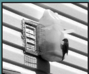
Grillage et boîte pour oiselets.

Note: les grillages pour orifices d'aération dans les murs ont une garantie de 10 ans.