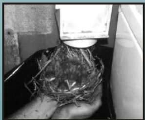
Risque d'incendie: nid et petits dans l'orifice d'aération de la sècheuse.