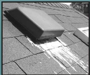
Fientes d'oiseaux dans l'exutoire de la toiture.