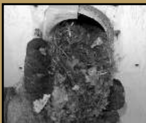
Souris dans un événement mural.