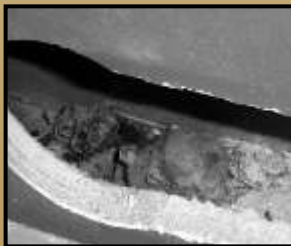
Carcasses de souris à l'intérieur d'un mur de chambre à coucher.